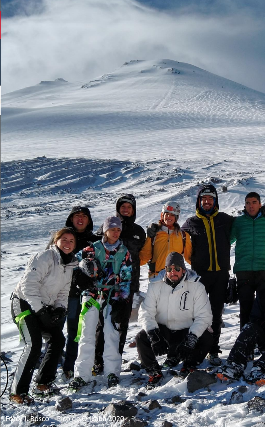
Pico de Orizaba 2020