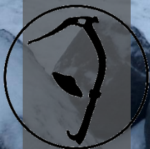
_ Pico de Orizaba 2021