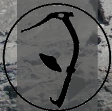
_ Pico de Orizaba 2021