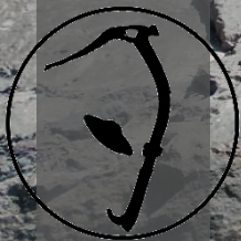
_ Pico de Orizaba 2021