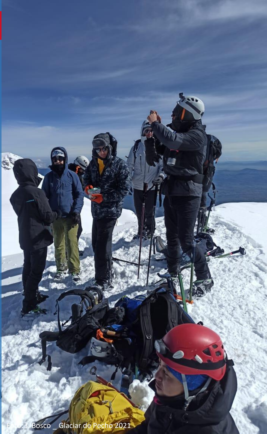
_ Glaciar de Pecho 2021