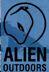
_ Cima Malinche 2021