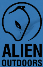
_ Iztaccíhuatl 2021